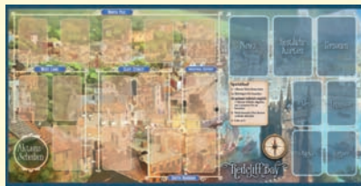
Vorderseite: Redcliff Bay